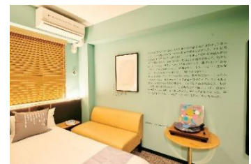
「詩のホテル」室内風景 (HOTEL SHE, KYOTO、2019)