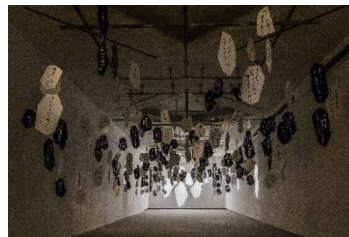
「最果タヒ 詩の展示」展示風景 (横浜美術館、2019年)

1986年生まれ。2006年、現代詩手帖賞受賞。2008年、第一詩集「グッドモーニング」で中原中也賞を受賞。2015年、詩集「死んでしまう系のぼくらに」で現代詩花椿賞を受賞。詩集をはじめ、エッセイや小説など著書多数。2018年に群馬県太田市美術館・図書館での企画展に参加、2019年に横浜美術館で個展開催、HOTEL SHE, KYOTOでの期間限定のコラボルーム「詩のホテル」オープンなど、幅広い活動が続く。最新刊は、自らの劣等感に光を当てて映る世界を紡ぐエッセイ集「コンプレックス・プリズム」。