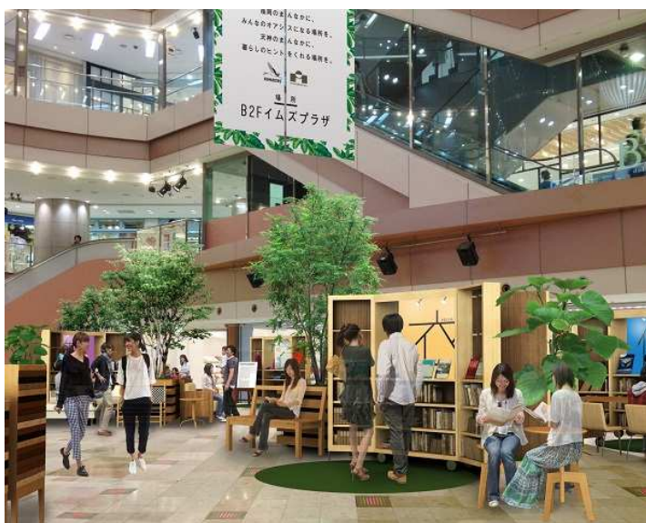
完成イメージ。2016年、夏・クリスマスシーズンは、特別企画を開催します。

『IMS BOOK GARDEN』は、イムズプラザで特別企画を開催しない期間恒常的なスペースとなります。天神を行き交う人たちの憩いや待ち合わせの場として利用されることも多いイムズプラザが、学びや新しいライフスタイルとの出会いの場へ魅力アップします。