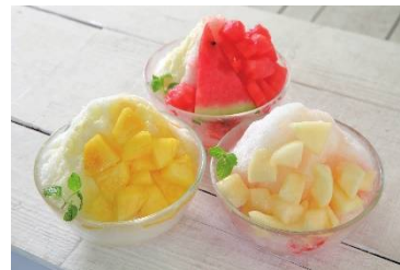
TOKIO (B1F) パインヨーグルトシャワー880円 /ピーチシャワー 880円 塩レモンスイカシャワー 880円

※ 館内での取材・撮影は、取材申込書の提出をお願いしております。お手数ですが、イムズ広報担当までご連絡をよろしくお願い致します