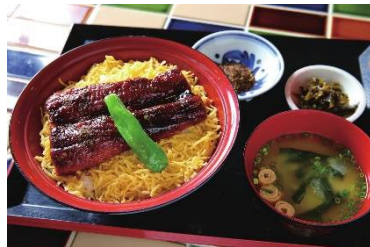
すし角打ち磯貝 しらすじら (13F) 磯貝の鰻丼 1,598円