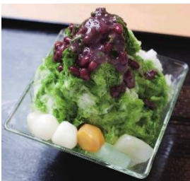
田頭茶舗 (B1F) 納涼かき氷 896円