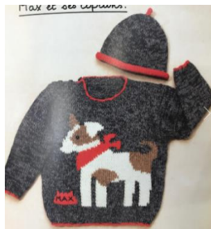
ニット材料代 ¥7,765程度

犬模様のセーターレシピアや編みぐるみのキットなど冬にぴったりのニットデザインから、他にはないデザインワッペンなどが揃います。お好みのカラーで編めたり、洋服やバッグを変身させたり他にはない犬グッズは、ここでできまり！