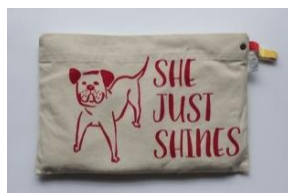
アンドパッカブルエプロン ¥2,700

エプロンポケットへコンパクトにたんで収納できるエプロン。男女問わず人気のアイテムで、犬デザインは特に売り上げ上位です。