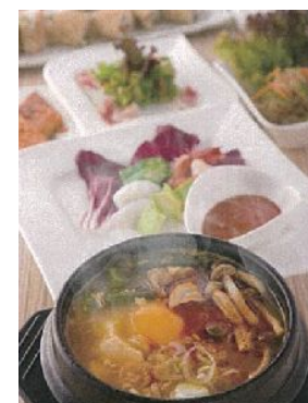
<12F 東京純豆腐 >