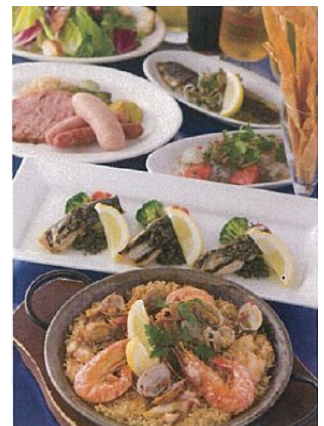
<12F KIRIN SOW-SOW>

ビール愛好家も大満足！6種のビールが飲み放題に！ 冬のパーティプラン(全7品)4,500円/フリードリンク90分/ 3名様より