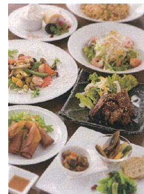
<13F HAKATA ONO >