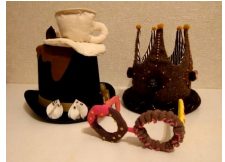
Gomaのスイーツアクセサリーイメージ (帽子やメガネなどで変身!)