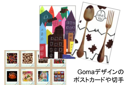
Gomaデザインのポストカードや切手