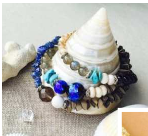
ホタルガラス3連 プレスレット 5,800円(税抜)

ホタルガラスや珊瑚など、沖縄発のアクセサリーショップジーナが夏にぴったりのアイテムをラインナップ！ これからの季節、カジュアルになりがちなシンプルスタイルにも、重くなりがちなジャケットスタイルにも“夏のこなれ感”を演出してくれるのが、天然素材がふんだんに使われた3連のプレスレットや色のキレイなピアス、そしてアンクレットです。浴衣にもぴったりフィットしそう。