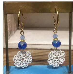
白い花のモチーフと青い透明感が涼しげ。2,500円(税抜)