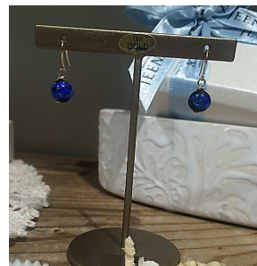
シンプルで浴衣におしゃれ感をプラスできそう。ホタルガラスK18フックピアス/7mm 7,500円(税抜)