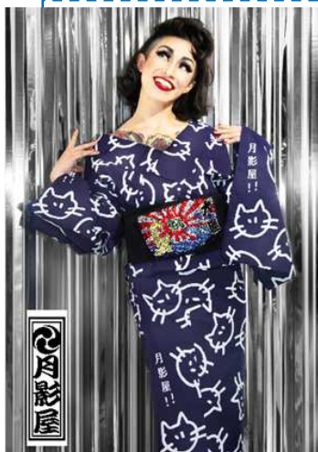
▲今年発表のポップな猫ちゃんデザイン

ここ数年、大人の夏のお洒落アイテムとして浴衣が定番化。夏祭り、花火大会だけでなく、ワイン会やちょっとした集まりにも個性が出しやすいアイテムとして重宝されています。イムズでは、夏のドレスアップのトレンド兵器として、最新浴衣が続々登場! クラシックスタイルから洋服感覚の最新スタイルまでデザインも豊富で楽しめます。また、浴衣にぴったりのアクセサリや、セルフメイクルームなど、気軽に浴衣を着ることができるショップもご紹介します。