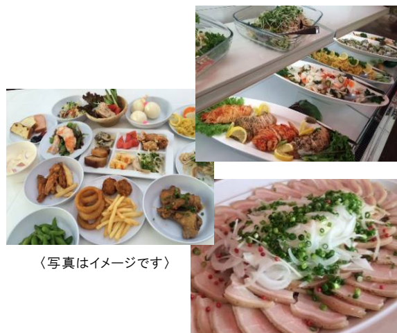
〈写真はイメージです〉