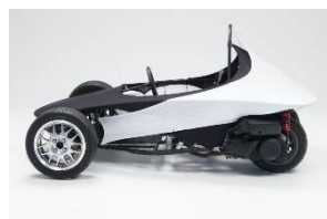
〈学生連携〉 学術学部と理工学部が共同開発した「ライトウェイト・ビーグル」