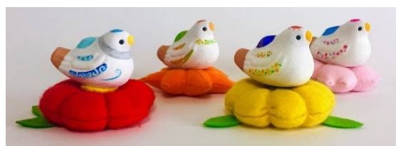
〈尾崎人形〉佐賀県神埼の伝統人形の新スタイル