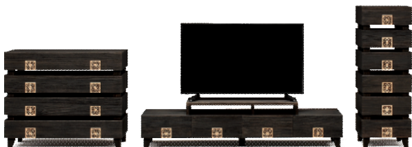
〈大川家具〉桐ダンスの新しいカタチ「TOTEM」