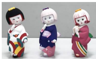
〈博多人形〉 「HAKATA DOLLS」のブランドで展開しているインテリア性を意識した博多人形