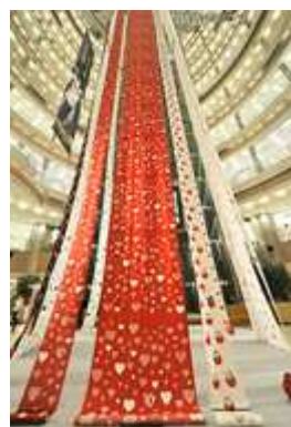
▲昨年開催の様子(イムズ)