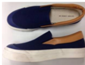
MUG × MOONSTAR