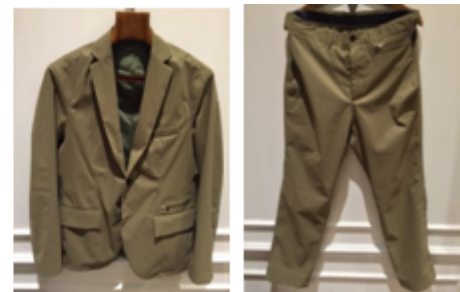
MINOTAUR × EDIFICE

COCONA WATERPROOF TAILORJACKET -39,000 COCONA WATERPROOF SLACKS -29,000