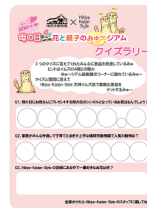
▲解答用紙に記入して参加