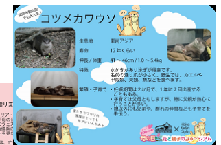
▲館内にあるヒントパネルを探して答えをゲット！