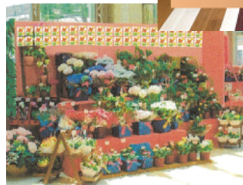
▲約200名分の子どもたちの絵が、GWから母の日のイムズを賑やかに彩ります。