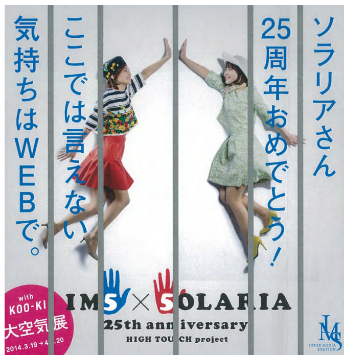
イムズビル懸垂幕

ソラリアプラザ・イムズ両施設のインフォメーションレディが、軽やかにハイタッチする、今回のプロジェクトを象徴するシーンを図案として採用しました。