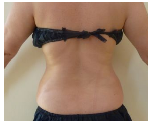
一度の施術で驚くほどスッキリ!