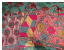
▲レ・ツリストの 手縫いエプロン3種 各4,725円

フランスの男性2人のデザイナーが作り出す1点もので毎年新柄が発表されるエプロンは、フランスらしい大胆な柄と鮮やかなカラーが印象的。毎年贈って集めるのもおすすめ。