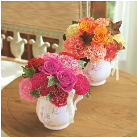
▲ アレンジメント「ロゼボヌール」ピンク／ 価格:5,250円(ギフトカタログより)

感度の高い母娘の支持もアツいイムズの母の日ギフト情報をお届けします。毎年好評のHIBIYA-KADAN STYLEの期間限定特別販売を今年も1Fアトリウムで開催。母の日アイテムが多数登場します。