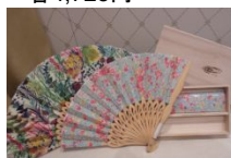
▲リパティ扇子 全4種類 各4,725円

イギリス老舗の生地メーカー、リパティ社の生地を使用した、BEAMSオリジナルの扇子です。柄は全部で4種類。どれも鮮やかなプリントが目を引きまします。BEAMSの刻印が入った木箱付きでこれからの季節にピッタリ。