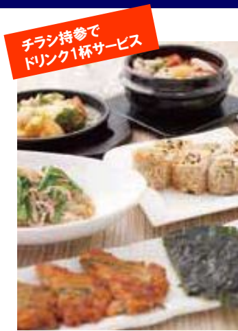
チラシ持参で ドリンク1杯サービス