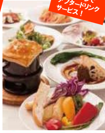
チラシ持参で アフタードリンク サービス!