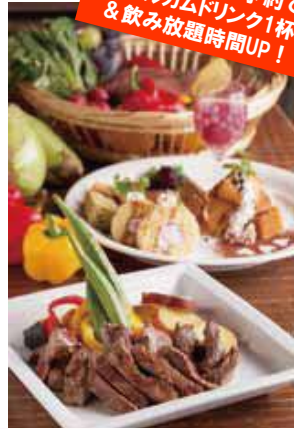
チラシを見たの予約で ウェルカムドリンク1杯 & 飲み放題時間UP!