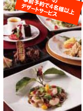
掲載メニューの 事前予約で4名様以上 デザートサービス